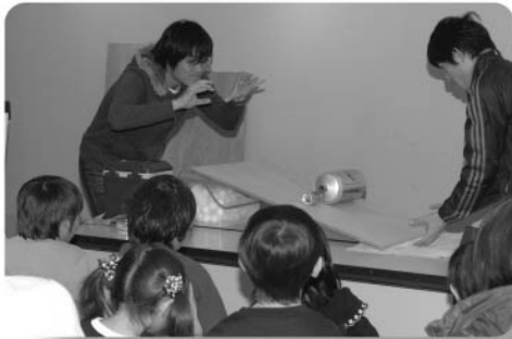
楽しい実験・ものづくり ～サカイエンスラボラトリー～

★サカイエンスラボラトリー (大ギャラリー) ～科学おもちゃづくり体験コーナー～